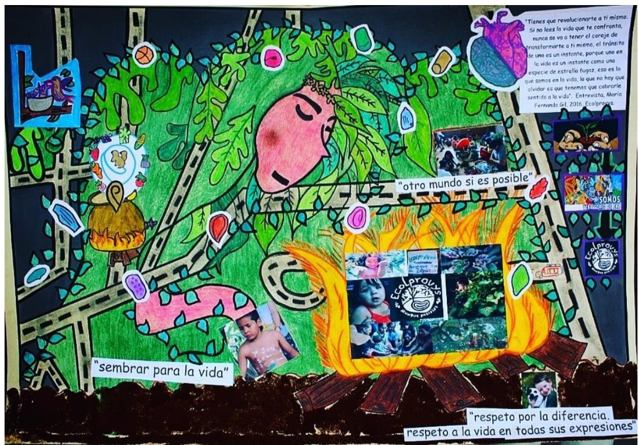
Cartografía 2: elaboración, estudiantes investigadoras, comunidad Ecolprovys