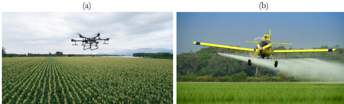
Figura 2. (a) Drone DJI Agras T30, (b) Avión Airtractor 502B.