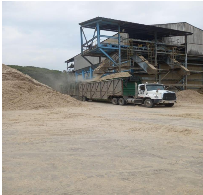
Figura 2. Acopio y transporte del bagazo de caña de azúcar para compostaje

Acopio y carga del bagazo de caña de azúcar proveniente del proceso industrial, destinado a la elaboración de compost. Esta fase inicial consiste en la recolección y traslado del subproducto desde la planta de procesamiento hasta las áreas designadas para el compostaje.