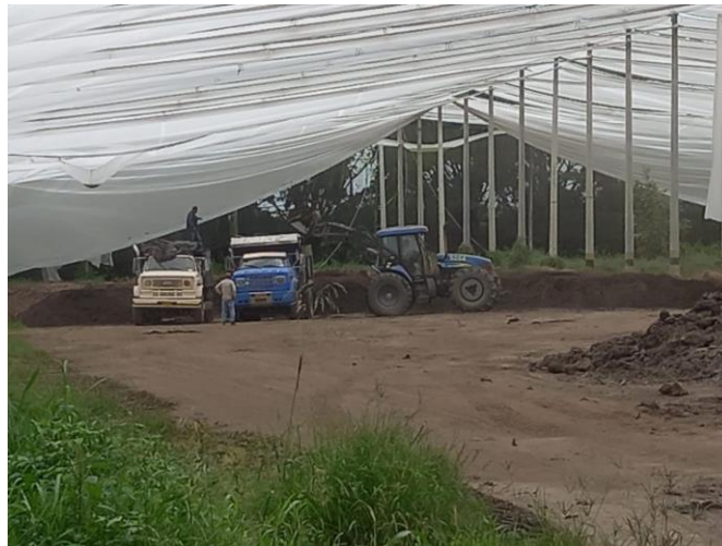
Figura 4. Carga del compost final para su aplicación agrícola

Proceso de carga del compost terminado, destinado al lote agrícola donde será aplicado como fertilizante orgánico dentro de las operaciones del Ingenio Río Paila Castilla. La imagen ilustra la etapa final del ciclo de compostaje, en la cual el material previamente procesado se prepara para su transporte y uso en campo.