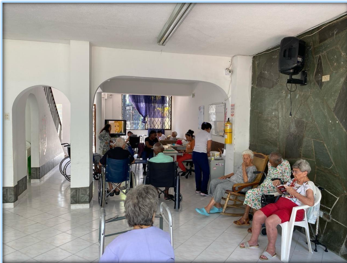
Imagen 2. Un espacio de encuentro.