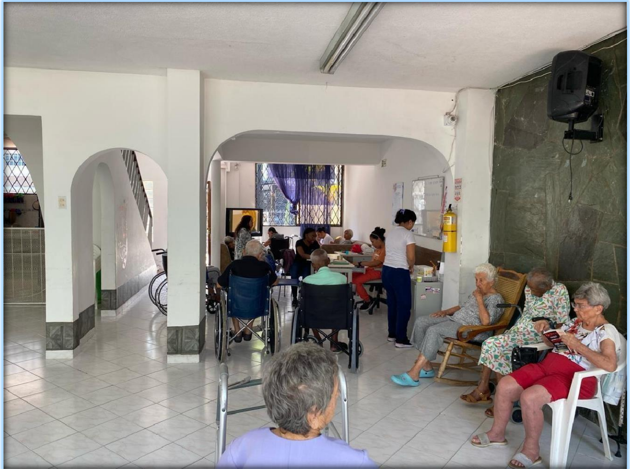
Imagen 4. Refugio en la literatura.