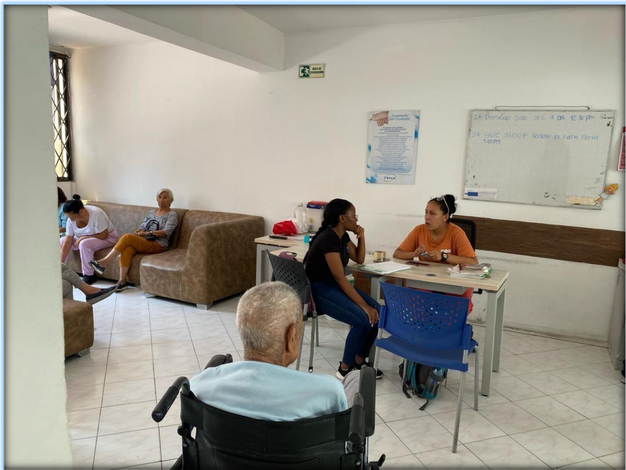
Imagen 5. Intercambio de palabras.