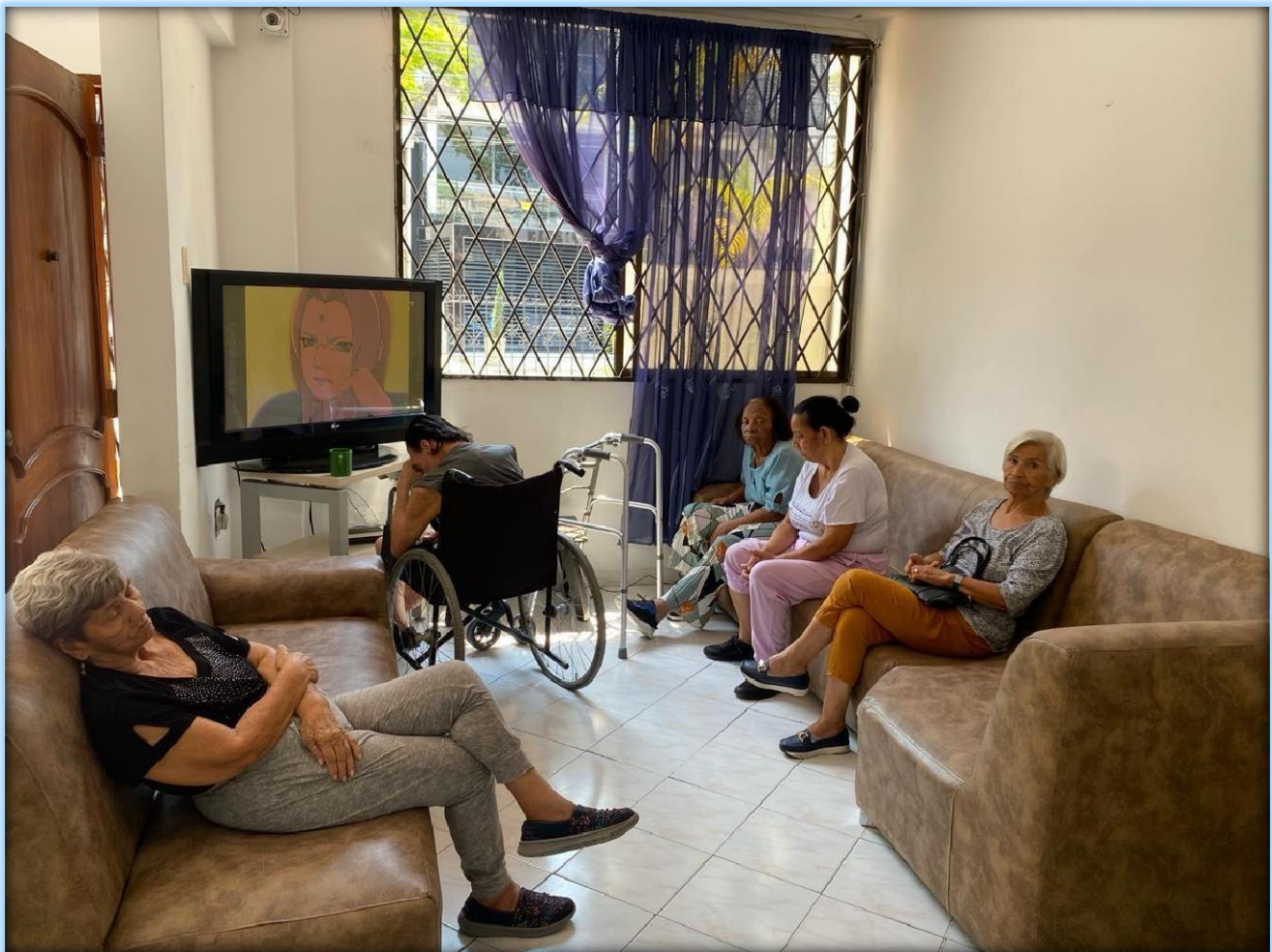
Imagen 6. Los abuelos en la sala.

“Es importante que en los hogares geriátricos donde se encuentren estas personas puedan tener el acceso a lo que es los dispositivos y a la conectividad, es decir, que tengan equipos de cómputo, tabletas, celulares y que tengan un acceso a Internet. Teniendo estos equipos vamos a ayudar a que se reduzca esta brecha, con que también, como decía anteriormente, concapacitaciones que se le puedan hacer a estas personas adultas mayores por medio de personas que estén calificadas para educar y para que podamos hacer alfabetización digital, que ellos se sientan escuchados, que se sientan valorados, que tengan esa idea de que siguen siendo útiles para la sociedad, porque desafortunadamente cuando están en los hogares geriátricos, algunos se sienten que ya no tienen la misma utilidad ante la sociedad. Entonces el poderlos involucrar al crear el tema que se vaya a dictar o al crear la actividad digital, eso los hace que se sientan valorados.” Cindy Álvarez Martínez, Nutricionista Dietista, Magíster en Comunicación Estratégica, docente del Programa de Nutrición y Dietética de la Institución Universitaria Escuela Nacional del Deporte.