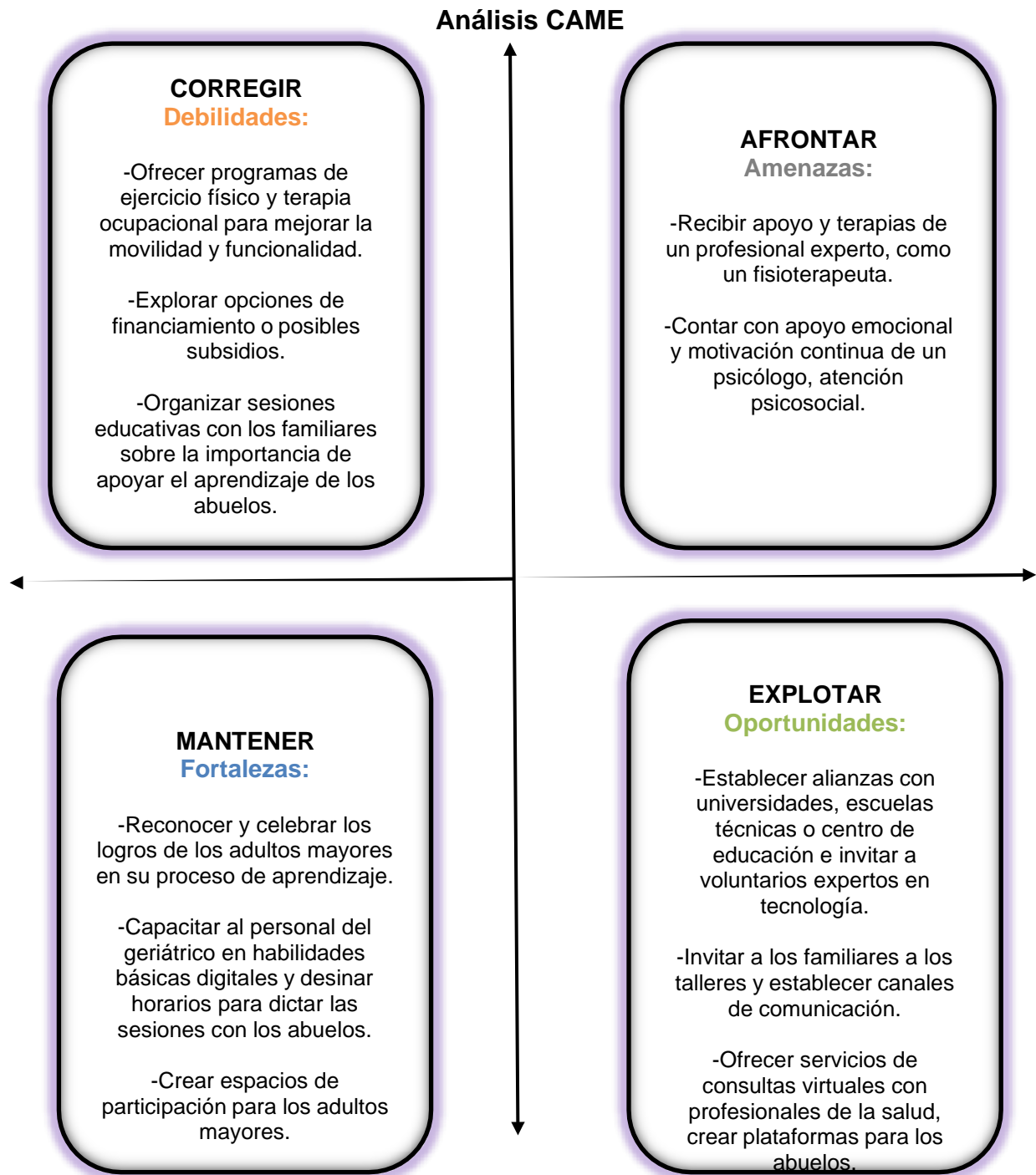
Cuadro No. 6