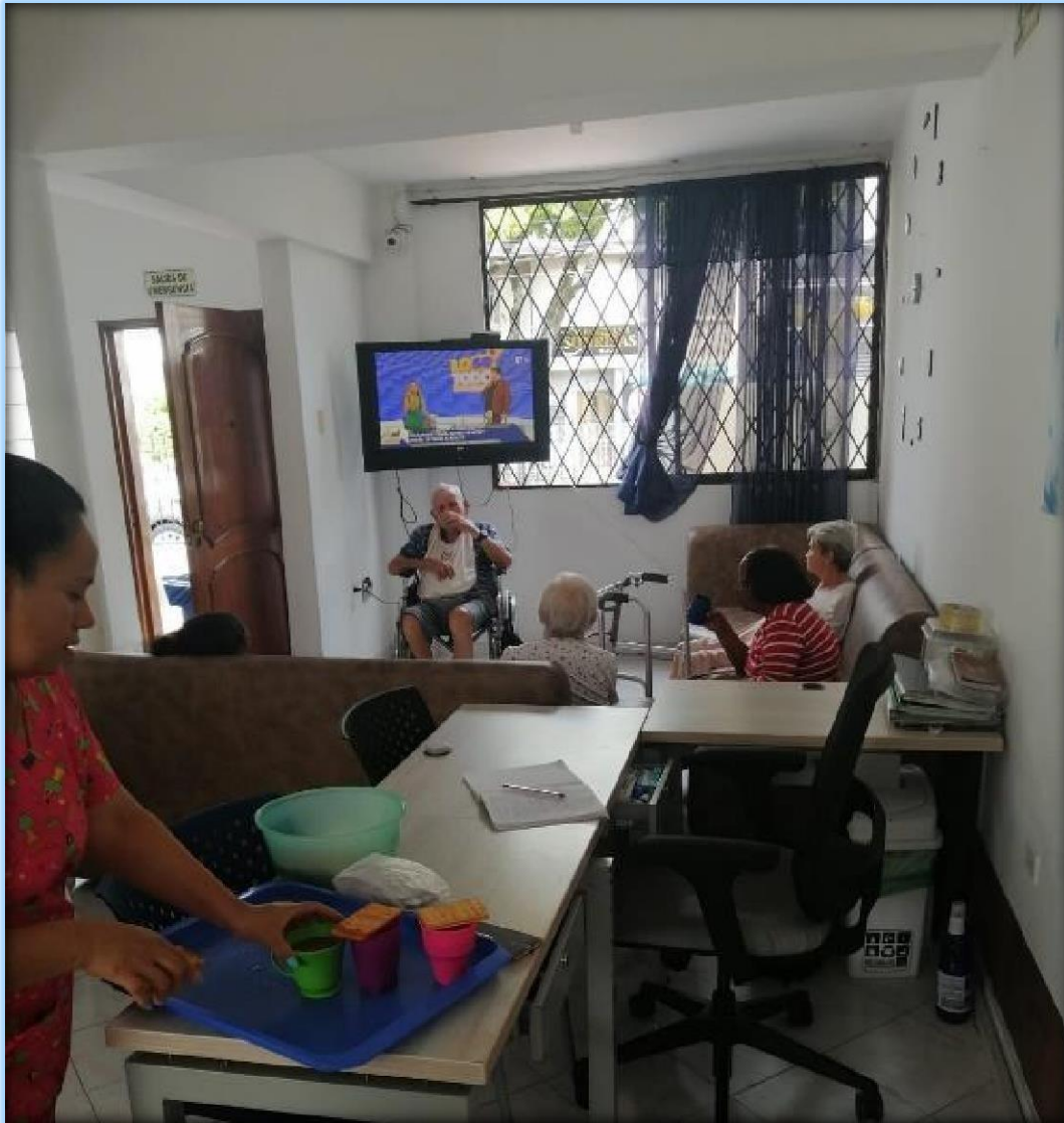
Imagen 1. Momento de entretenimiento.