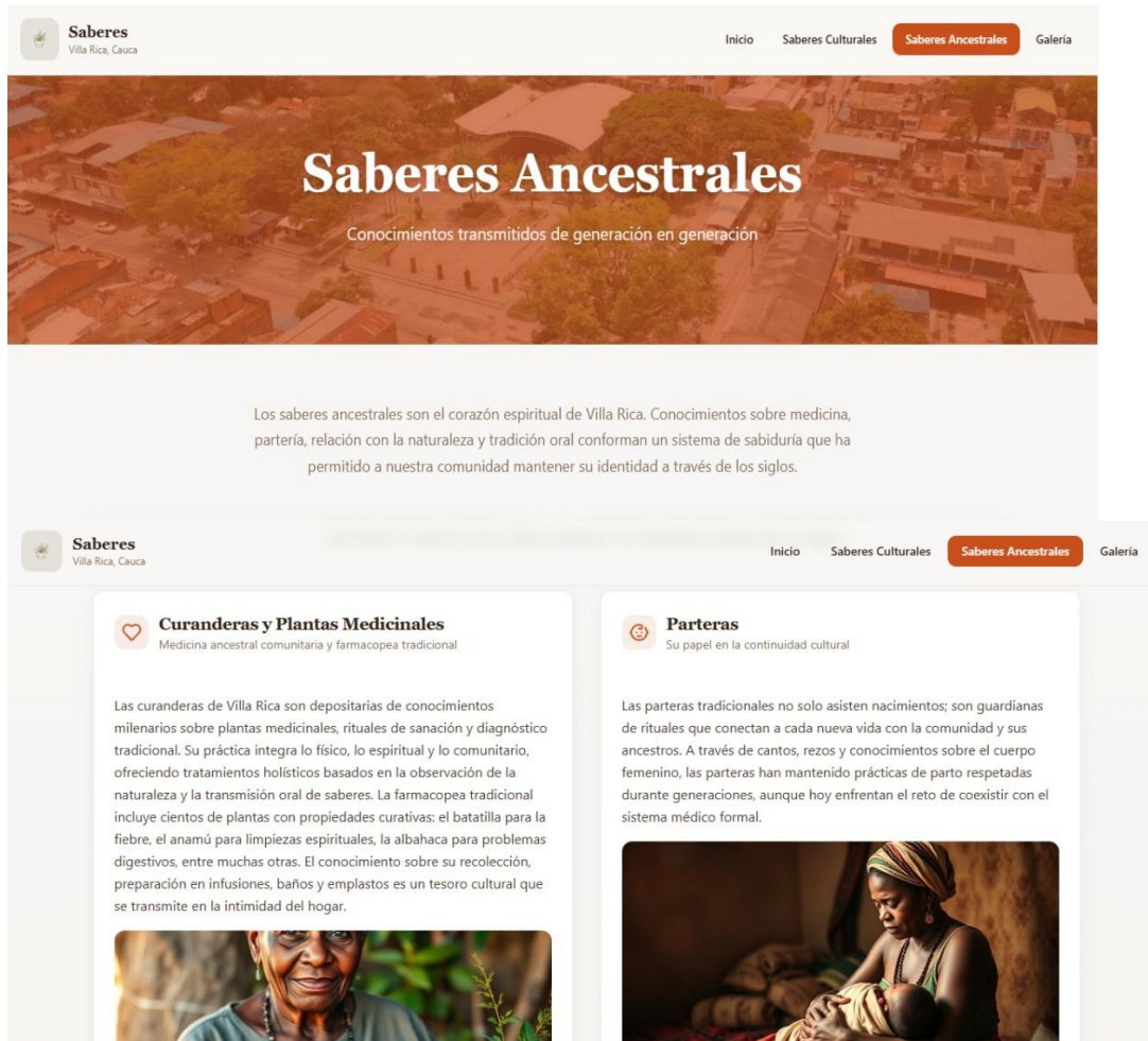
Página de saberes ancestrales

La sección saberes ancestrales, presenta con aquellos conocimientos transmitidos de generación en generación. En este espacio se encuentran los temas como la partería, la medicina ancestral. Mas abajo están los diferentes bloques que representan cada saber.