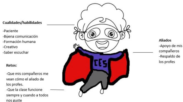
Gráfica 1. Cualidades, habilidades, aliados y retos del héroe CES (representante estudiantil) resultado de entrevista

que representa el ser un líder y a su vez que responsabilidad se tiene al serlo.