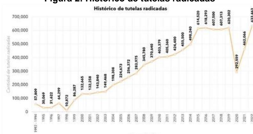
Figura 2: Histórico de tutelas radicadas

aterriza como un mecanismo fundamental al momento de hacer efectiva la ejecución de las sentencias judiciales en este territorio nacional. Al respecto, los datos estadísticos que permite el informe de gestión del año 2022 realizado por parte de la Corte Constitucional, deja saber que para ese año se presentó el mayor número de tutelas radicadas en la historia de la Corte Constitucional con un total de 633.463, presentando con ello un fundamento fuerte al momento de hablar de la importancia de esta herramienta constitucional para los colombianos.