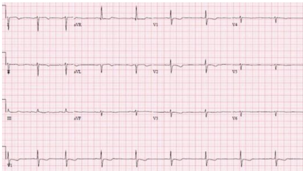
Figura 1. Electrocardiograma

Dentro de sus antecedentes personales, comenta haber presentado a mediados del año 1998 cuando tenía 50 años un cuadro clínico consistente en dolor tipo cólico en fosa iliaca derecha, de intensidad 7/10 por lo cual acudió al servicio de urgencias donde determinaron que el cuadro era sugestivo de apendicitis porque presentaba leucocitosis, fiebre, defensa voluntaria a la palpación abdominal y descompresión dolorosa. Decidieron llevarlo a cirugía para intervención quirúrgica, inicialmente tomaron electrocardiograma (Figura 1) donde evidenciaron eje desviado a la derecha, frecuencia cardiaca 65 latidos por minuto. Cabe recordar que el eje eléctrico en el electrocardiograma representa la suma vectorial de la despolarización ventricular, por lo que normalmente la mayor magnitud se dirige al ventrículo izquierdo, el eje normal se encuentra entre -30^\circ y +100^\circ , (12) a diferencia de este electrocardiograma (Figura 1) que se encuentra con un eje en 150^\circ .