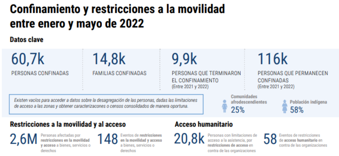
Figura 3 Afectados por la violencia a corte de mayo de 2022

Para complementar esta revisión documental, el segundo registro analizado fue el “Informe de Tendencias e Impacto Humanitario en Colombia 2022 (enero a mayo)” , como muestra la siguiente figura: